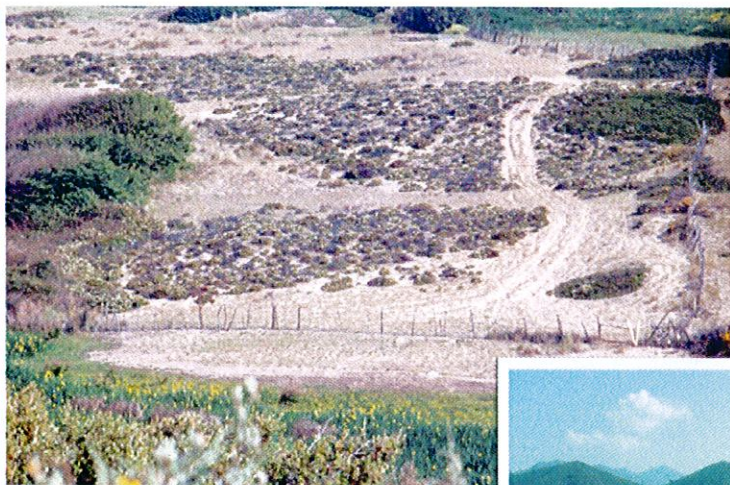
Golfe de Lava, chemin du berger, 1989

Cet échec a provoqué l'interruption de toute intervention sur le terrain, ce qui a eu pour conséquence la poursuite de la dégradation du site, et des espèces et habitats qu'il abrite, sous la pression d'usages individuels incontrôlés.